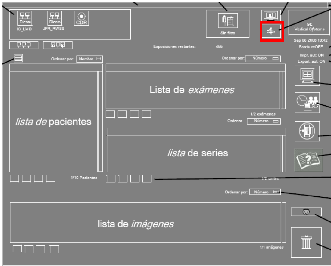
Figura 1. Ventana principal de la aplicación, con el botón "Menú Herramientas" resaltado.